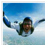
Viaggiare ti rende più coraggioso