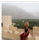
Eisabetta: Mi prendo un anno sabbatico: vado a scrivere in Oman!