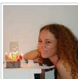
Arrenditi a te stesso! Come ti vedi fra 10 anni?