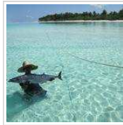
Maldive e Seychelles: nuova offerta Qatar!