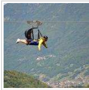
Fly Emotion: io e Ale in volo sulla Valtellina!