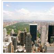
New York in autunno e inverno: 505 Euro!