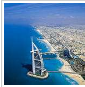
Speciale Dubai Low Cost: 379 Euro!