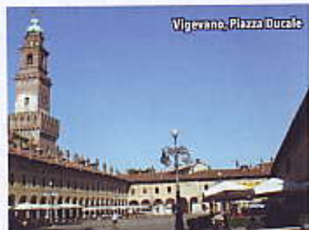
Vigevano, Piazza Ducale

cercatori d'oro . È comunque possibile personalizzare il proprio percorso di navigazione scegliendo tra quelli che si snodano da Magenta a Vigevano , oppure da Bereguardo , presso il ponte delle Barche, fino a Pavia . L'itinerario, che ha come base di partenza Pavia, prevede una prima parte di navigazione caratterizzata dalla presenza di vegetazione e il secondo tratto inserito invece in un contesto storico paesaggistico notevole: si vede, infatti, la cupola del Duomo di Pavia , si passa sotto lo storico Ponte Coperto , si ammira la statua della