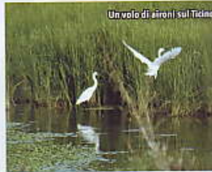
Un volo di aironi sul Ticino