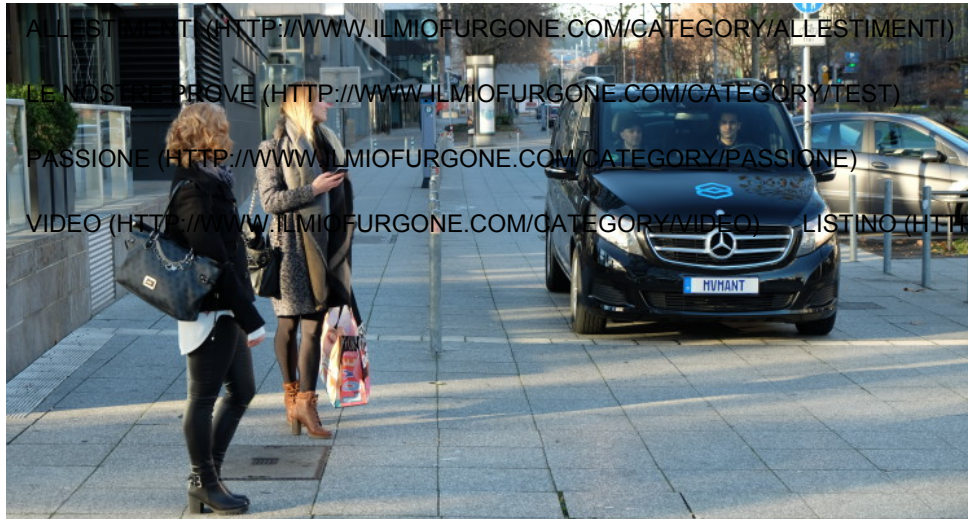
( http://www.ilmiofurgone.com/wp-content/uploads/2016/03/arrivaltopickup-e1457606030684.jpg )

NEWS (HTTP://WWW.ILMIOFURGONE.COM/CATEGORY/NEWS)