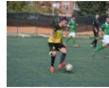
Atl. Torbellamonaca calcio (I cat.),