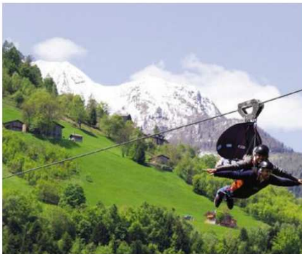
L'esperienza valtellinese di Fly & Drive

Il pacchetto Fly&Drive, offre la possibilità di passare dall'adrenalina di una corsa in go-kart, sul circuito indoor di ultima generazione di Lario Motorsport di Colico, all'emozionante volo proposto da Fly Emotion che permette di sorvolare ad alta velocità, come un'aquila, il panorama mozzafiato della Valle del Bitto. Le due attrazioni distano circa mezz'ora l'una dall'altra e il pacchetto, prenotabile presso un unico referente, dà la possibilità di scegliere orari e successione: liberi quindi di decidere se volare prima, o dopo la corsa, in go-kart.