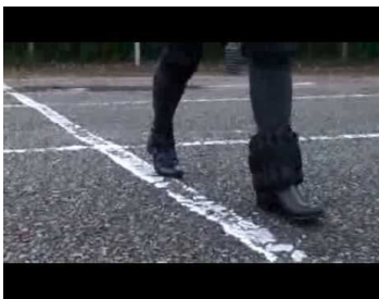
Ford: ricerca sulla guida in stato d'ebbrezza