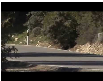
Renault Clio R.S. 200 EDC Monaco GP