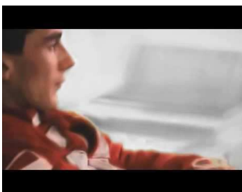
20 Anos do Legado de Ayrton Senna #SennaSempre