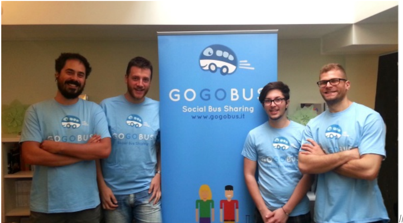
Team di GoGoBus

Ad inizio 2015, viene fondata GoGoBus . Un'azienda giovane e una giovane azienda che crede che le soluzioni per la mobilità alternativa siano molte e non ancora del tutto sfruttate. Nasce così un servizio del tutto nuovo per condividere e organizzare in maniera semplice viaggi in pullman: il Social Bus Sharing .